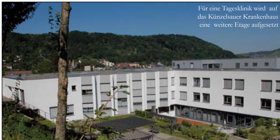
Für eine Tagesklinik wird auf das Künzelsauer Krankenhaus eine weitere Etage aufgesetzt